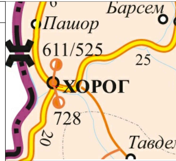
СХЕМА РАСПОЛОЖЕНИЯ ОБЪЕКТА